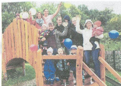
Wir gemeinsam für unsere Kinder